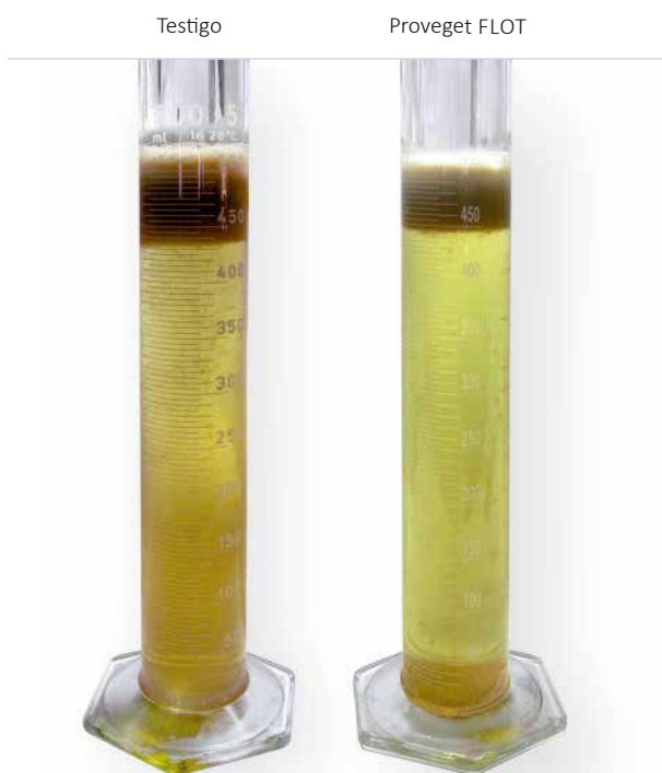
Figura 1: Mosto testigo y mosto tratado con 10 g/hl de Proveget FLOT

Atención: Se recomienda realizar ensayos de laboratorio para determinar la dosis de empleo óptima, pues depende en gran medida de las características propias de cada mosto. A las dosis indicadas Proveget FLOT no aporta inestabilidad proteica.