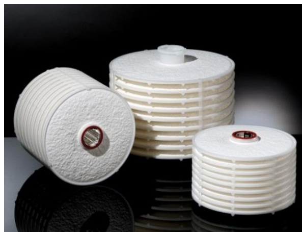
Permeabilidad al agua gama BECODISC

Los módulos de filtración en profundidad BECODISC son muy poco catiónicos. Por tanto, durante la filtración apenas se produce una adsorción relacionada con la carga. En consecuencia, no se adsorben ingredientes que aportan valor y estos se mantienen en el filtrado. La resistencia química y la estabilidad mecánica son excepcionalmente altas.