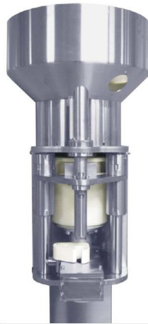
TOLVA ALIMENTACION CORCHOS